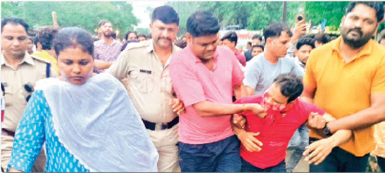
हरिभूमि न्यूज ▶▶ सारंगपुर