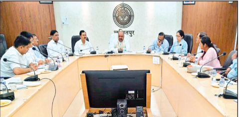
स्वावलम्बी एवं आत्मनिर्भर बनाना अत्यंत आवश्यक है। उन्होंने सभी अधिकारियों को सुझाव दिया कि गौशालाओं से निकले वाले गोबर, गोमूत्र, गोबर के गमले, पेंट, मूर्ति एवं अन्य उत्पादों का सपुण्यकरण कर जैविक खाद, कोंटनशाक, फिनायल