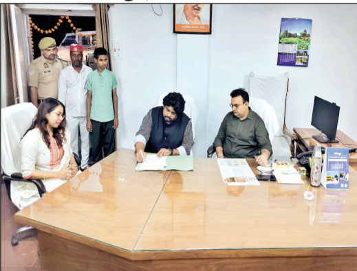
जनकल्याणकारी योजनाओं का लाभ प्राथमिकता के आधार पर दिलाया जायेगा। उन्होंने अधिकारियों को निर्देशित करते हुए कहा कि जनपद के सभी अधिकारी अपने कार्यों का भलीभांति निर्वहन करें, किसी भी कार्य में अनावश्यक विलम्ब न करें। सभी कार्यों को समय सीमा के भीतर पूर्ण करें। यदि कोई व्यक्ति किसी योजना के लिए अपात्र है तो उसकी अपात्रता का कारण लिखित रूप से उस व्यक्ति को दे ताकि वह अनावश्यक यहाँ-वहाँ न भटकें।

दूसरी पोस्टिंग बस्ती में ज्वाइंट मजिस्ट्रेट रूप में, बलरामपुर में मुख्य विकास अधिकारी, गौतमबुद्धनगर में अति0 कार्यकारी अधिकारी ग्रेटर नोयडा, लखनऊ में विशेष सचिव उ0प्र0 सरकारी एपीसी ब्रांच तथा वर्तमान में ललितपुर में जिलाधिकारी के रूप में पदभार ग्रहण कर रहे हैं। उन्होंने अपनी प्राथमिकताएं बताते हुए कहा कि जनपद में सभी निर्माणाधीन परियोजनाओं को तेजी से पूर्ण कराया जाएगा, पर्यटन स्थलों का विकास के साथ ही गौशालाओं की स्थिति सुदृढ़ की जायेगी, अन्ना जानवरों के विचरण पर प्रतिबंध के ठोस उपाय किए जाएंगे। अवैध खनन पर अंकुश, स्वास्थ्य सेवाओं को और बेहतर किया जाएगा तथा प्रत्येक पात्र व्यक्ति को सरकार की