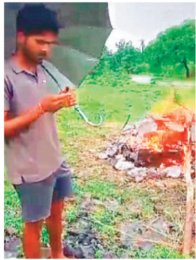
लापरवाही की जानकारी सीईओ को दी गई, तो उन्होंने तत्काल संबंधित ग्राम पंचायत से स्थिति

जनपद पंचायत सारंगपुर की ग्राम पंचायत बारोल में एक ऐसी घटना सामने आई जिसने न केवल प्रशासन की कार्यप्रणाली पर सवाल खड़े कर दिए, बल्कि मानवता को भी शर्मसार कर दिया। ग्राम बारोल में एक आदिवासी परिवार में मृत्यु होने के पश्चात शांति धाम (शमशान घाट) के अभाव के कारण परिजनों को पूरे दिन अंतिम संस्कार के लिए प्रतीक्षा करनी पड़ी। जानकारी के अनुसार, गांव में बारिश लगातार जारी थी और चूँकि गांव में कोई पक्का शमशान स्थल नहीं था, इसलिए अंतिम संस्कार के लिए उपयुक्त स्थान उपलब्ध नहीं हो सका। जैसे-तैसे बारिश थमी, तब जाकर परिजनों ने कीचड़ व जलभराव के बीच अपने स्वजन की अंतिम विदाई दी।