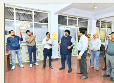
निस्तारण के निर्देश दिये। उन्होंने कहा कि कोई भी फरियादी मायूस होकर न लौटे, यदि उसकी समस्या वास्तविक है तो निस्तारण होना ही चाहिए। इसमें किसी भी स्तर पर लापरवाही नहीं होनी चाहिए। इसके उपरान्त जिलाधिकारी ने एक-एक कर कलेक्ट्रेट अवन

कलेक्ट्रेट के विभागों और पटलों का निरीक्षण कर अधिकारियों को अपडेट रहने के दिग्दि नदिश ललितपुर। मीडिया से वार्ता कर जनपद के बारे में जाना और मिलजुल कर जिले का विकास करने की बात कह नवागंतुक जिलाधिकारी अमनदीप डुली ने प्रथम कार्यादिवस अपने कार्यालय कक्ष में जनसुनवाई की। जनसुनवाई के दौरान जिलाधिकारी ने दूरदराज से आये नागरिकों की समस्याओं को गंभीरता से सुना और सम्बन्धित अधिकारियों को त्वरित समाधान के निर्देश दिये। उन्होंने स्पष्ट कहा कि जनता की शिकायतों का समयबद्ध एवं गुणवत्तापूर्ण निस्तारण शासन की सर्वोच्च प्राथमिकता है, इसके लिए सभी अधिकारी अपने कार्यालयों में निर्धारित समय में जनसुनवाई करें। उन्होंने फरियादियों को अपने पास बैठकर उनकी समस्याओं को सुना और उनके शिकायती पत्रों को सम्बन्धित अधिकारियों को प्रेषित करते हुए त्वरित व गुणवत्तापूर्ण